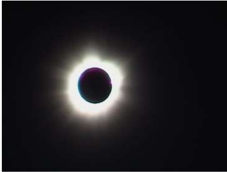
Obrázok 18: Biela koróna z roku 1911.

otváralo dvere do vysokopostavených spoločenských a politických kruhov. Bol teda dobrým popularizátorom astronómie.