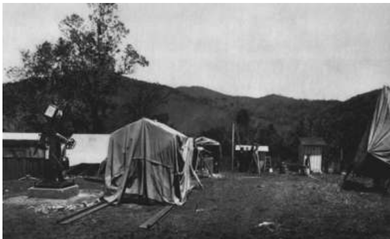
Obrázok 15: Pozorovacie stanovište pre pozorovanie koróny na ostrove Vavau v súostroví Tonga (1911).

1912 - 11.-13. marca je v Prahe, kde sa uchádzal o miesto docenta a žiadal o vybudovanie hvezdárne.