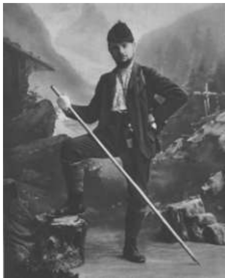
Obrázok 3: Štefánik počas štúdijného pobytu v Zürichu

28.10.1904 Štefánik odišiel do Paríža, aby tu pokračoval v štúdiu astronómie. Ako sám uvádza, „ priazňou osudu dostal sa na slávnu hviezdáreň meudonsku (začiatkom roka 1905), kde riaditeľ Janssen značne prispel a prispieva k založeniu mojej budúcnosti “ (25.1.1906, v liste Českej akadémii cisára Františka Josefa pro vědy, slovesnost a umění, v ktorom žiadal o štipendium na pobyt v Paríži, ale ho nedostal). J. Janssen bol riaditeľom hviezdárne v Meudone pri Paríži (dnes súčasť Paríža), a mal tiež svoje vlastné observatórium na Mont Blancu - najvyššom vrchole Álp v nadmorskej výške 4810 m. Štefánik pracoval na Meudone z viacerých dôvodov len do začiatku roku 1908. Potom sa zaoberal hľadaním vhodných miest na výstavbu novej hviezdárne v Severnej Afrike (1908-1909), Tahiti (1910-1911), organizáciou expedícií za zatmeniami Slnka a reorganizáciou hviezdárne v Quite (Ekvádor). Čím ďalej tým viac sa ale zapájal do politiky, v ktorej napokon aj definitívne skončil.