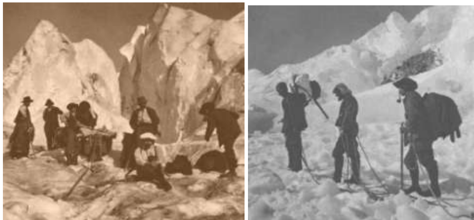
Obrázok 5: Výstup na Mt. Blanc. Štefánik sedí v popredí (vľavo); vpravo – uprostred.