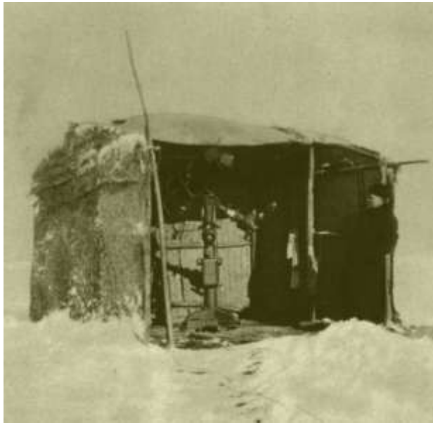
Obrázok 9: Štefánikova pozorovateľňa úplného zatmenia Slnka v Ura Tjube (1907).

horizontom, aby mohol určiť, ktoré z nich sú telurické (vznikajú v zemskej atmosfére, napr. spektrálna čiara A o vlnovej dĺžke 759 nm je telurická), a ktoré majú svoj pôvod na Slnku. V ultrafialovej oblasti spektra sa Štefánik dopracoval až k vlnovej dĺžke 383,0 nm, kým oficiálny údaj udával krajnú hranicu 393,0 nm (rozdiel je 100 angströmov, čo je dosť veľa). Pre tieto pozorovania používal špeciálne filtre, aj vylepšený spektroskop. Aby zmenšil straty svetla pri prechode optikou, používal autokolimačné hranoly, ktoré si sám vyrobil. Keďže nemohol ísť za hranicu 1000 nm, kladie si otázku: „ ktorá súčiastka spektroskopu (filter?) spôsobuje všeobecné pohlcovanie? “. Odpoveď si dať nemohol, pretože to nie je dané chybou prístroja, ale necitlivosťou oka v tejto časti spektra a ním používaného fotografického materiálu. V tejto súvislosti hádam stojí ešte za zmienku uviesť jednu vetu z jedného jeho článku: „ zistil som všeobecný zákon, že farebné filtre, pohltiac parazitné svetlo, zlepšujú viditeľnosť a zreteľnosť čiastky spektra, ktorá nimi prechádza . V poznámke ďalej ešte uvádza, že maximálna viditeľnosť sa dosiahne, keď filter prepúšťa iba úzky pruh spektra. Týmito poznámkami vlastne definuje monochromatické filtre, dnes, i keď na inom základe, bežne používané. A nielen v astronómii.