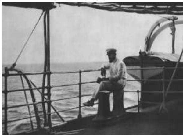
Obrázok 12: Cestou na Tahiti.