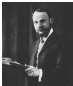
Obrázok 1: M. R. Štefánik