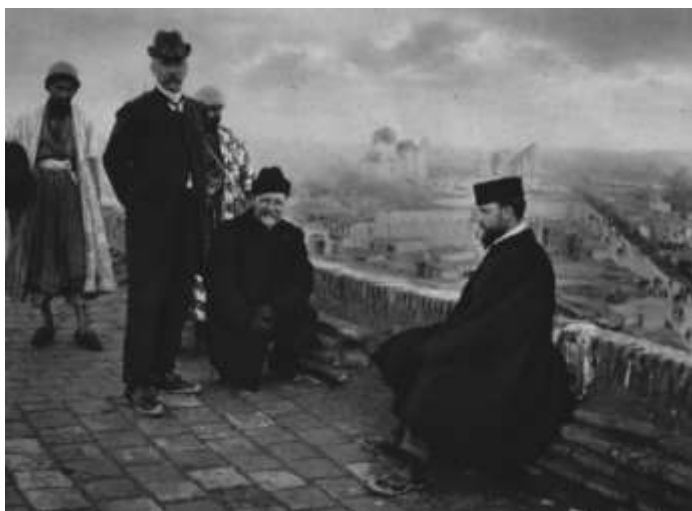
Obrázok 11: Štefánik po zatmení Slnka v Samarkande (1913).

Veľmi jemnú štruktúru s rozlišovacou schopnosťou až 0,6 oblúkových sekúnd a rôzne detaily opisujú pri pozorovaniach planéty Jupiter. Taktiež opísali existenciu tmavých škvŕn na Merkúre. V závere svojho článku zdôrazňujú, že „ atmosférické podmienky na vrchole Mt. Blancu poskytujú tak zreteľné obrazy, že toto pozorovacie miesto stáva sa jedným z najpriaznivejších pre štúdium povrchu planét “. Žiaľ, pekné počasie na Mt. Blancu tak často nebývalo, ako sa o tom neskôr aj sám presvedčil.