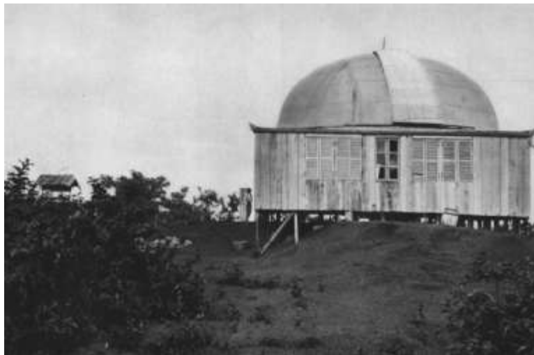
Obrázok 14: Štefánikova hviezdáreň na Tahiti.

1911 - presun z Tahiti (odchod 24. februára) na ostrov Vavau v súostroví Tonga, kde 28. apríla úspešne pozoroval úplné zatmenie Slnka. Do Paríža pricestoval 20. júla cez Fidži, Austráliu a Ceylon.