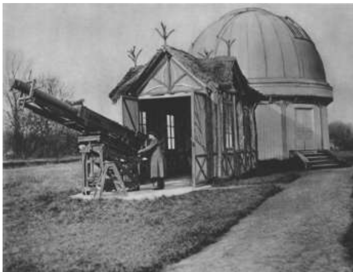
Obrazok 7: Pozorovanie Slnka v Meudone.