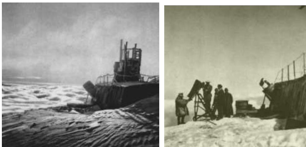
Obrázok 6: Pozorovateľňa na Mt. Blancu. Štefánik pri pozorovaní na pravom obrázku je celkom vľavo.