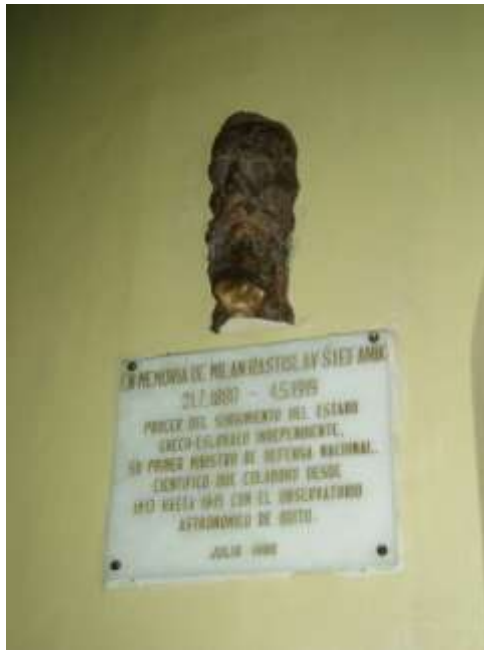
Obrázok 19: Busta M. R. Štefánika na hvezdárni v Quite (Ekvádor).

Napriek krátkemu účinkovaniu Štefánika na poli astronómie, sa mu podarilo splniť to, čo je vyššie napísané. Svojimi výsledkami sa zapísal do rozvoja astronómie. Škoda, že v nej nemohol pracovať dlhšie, hoci po tom stále túžil. Štefánik mi svojou prácou pripomína jasný meteor, ktorý cez astronómiu príliš rýchle prebehol, ale jeho svetlo nezhaslo, ale naplno zažiarilo pri národooslobodzovacom boji Čechov a Slovákov, vznikom vlastného štátu, ČESKOSLOVENSKA 28. októbra 1918. Štefánik mal najväčšiu zásluhu na uvedení T. G. Masaryka do politických a spoločenských kruhov v Paríži. To je však už iná kapitola Štefánikovho života, podobne ako aj jeho činnosť ako vojaka, politika a diplomata v rokoch 1914 – 1919.