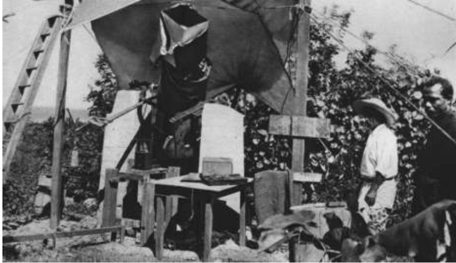
Obrázok 13: Pozorovacie stanovište na pozorovanie prechodu kométy Haley popred slnečný disk (1910, Tahiti).